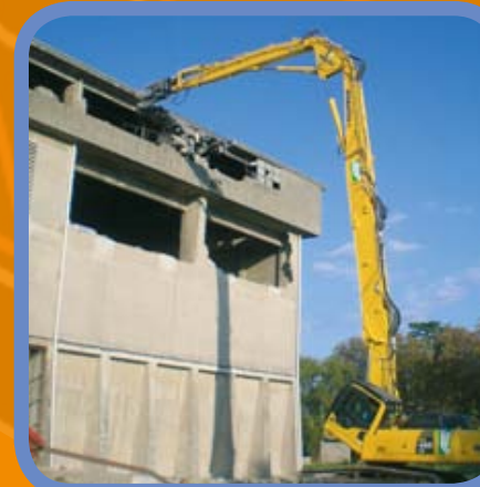
ESCAVATORE DA DEMOLIZIONE